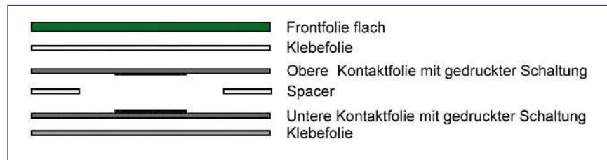
■ Bild 1: Folienmatrizen ohne taktile Rückmeldung sind einfacher aufgebaut und billiger in der Herstellung

Der Aufbau der Folien unterscheidet sich nach zwei grundsätzlichen Arten: Tastaturen mit oder ohne taktile Rückmeldung. Das heißt, entweder spürt der Anwender die Betätigung oder praktisch nicht. Der im Anschluss beschriebene Aufbau einer Folientastatur aus mehreren Layern bildet die Tasten einer Folientastatur. Diese Tasten werden an einen Tastaturcontroller angeschlossen, der die jeweils gedrückte Taste als geschlossenen elektrischen Schalter erkennt und das eigentliche Datenzeichen über die passende Schnittstelle (USB, PS/2 usw.) an das zu steuernde Rechnersystem ausgibt. Folienmatrizen ohne taktile Rückmeldung sind einfacher aufgebaut und somit billiger in der Herstellung. Sie sind leicht zu betätigen, haben aber den Nachteil, dass der Anwender keinen Tastendruck spürt (Bild 1). Die oberste Folie ist immer die rückseitig bedruckte Frontfolie. Sie hat die Aufgabe die Tastatur und deren Layout optisch darzustellen und