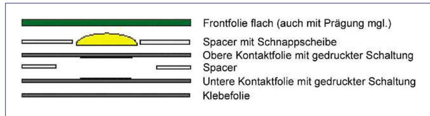
■ Bild 2: Folientastatur mit Rückmeldung – Hierbei ist eine Zwischenschicht mit einer Schnappscheibe integriert, die bei Betätigung ein taktiles Gefühl bewirkt

lässt sich farblich beliebig gestalten. Auch Ausschnitte für ein Display oder in die Tastatur eingebettete LEDs können durch entsprechende Fenster sichtbar werden. Darunter kommt eine Klebefolie. Diese ist mit der oberen Kontaktfolie, auf der die eine Hälfte der Leiterbahnen der Kontaktmatrix aufgedruckt ist, verklebt. Die nächste Schicht ist die beidseitig klebende so genannte Spacerfolie. Diese gewährleistet den Abstand zwischen der oberen und unteren Schaltung. Sie ist an den Stellen ausgeschnitten, an denen die Tasten liegen, um dort den elektrischen Kontakt der beiden Kontaktmatrizen bei Betätigung der Taste zu ermöglichen. Danach kommt die Folie mit der unteren Kontaktmatrix und ganz unten folgt eine weitere Klebefolie, mit der sich die Tastatur auf einem Gerät montieren lässt. Drückt man nun auf die Taste, so schließt sich der Kreis zwischen dem oberen und